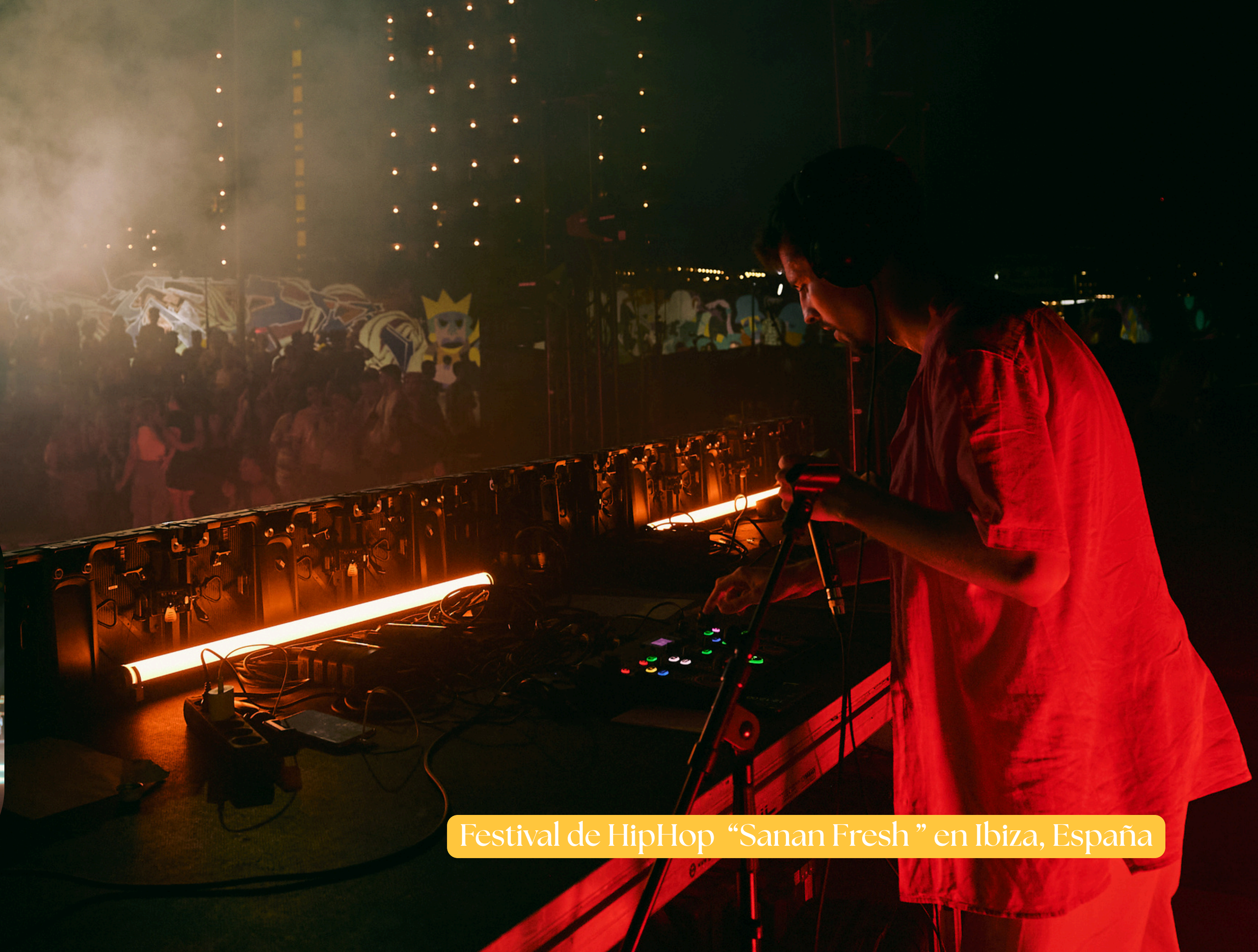
Festival de HipHop "Sanan Fresh" en Ibiza, España