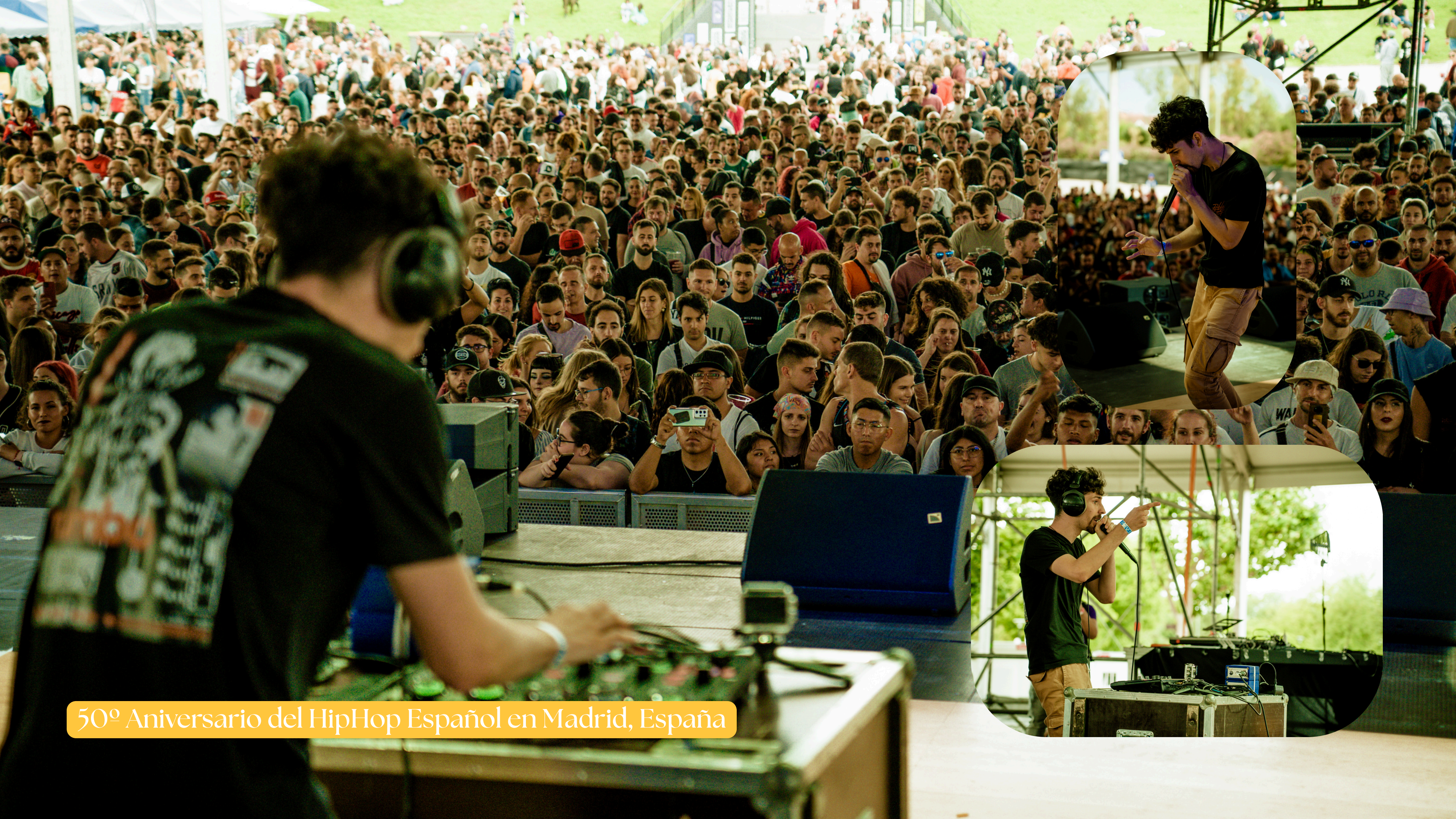
50º Aniversario del HipHop Español en Madrid, España