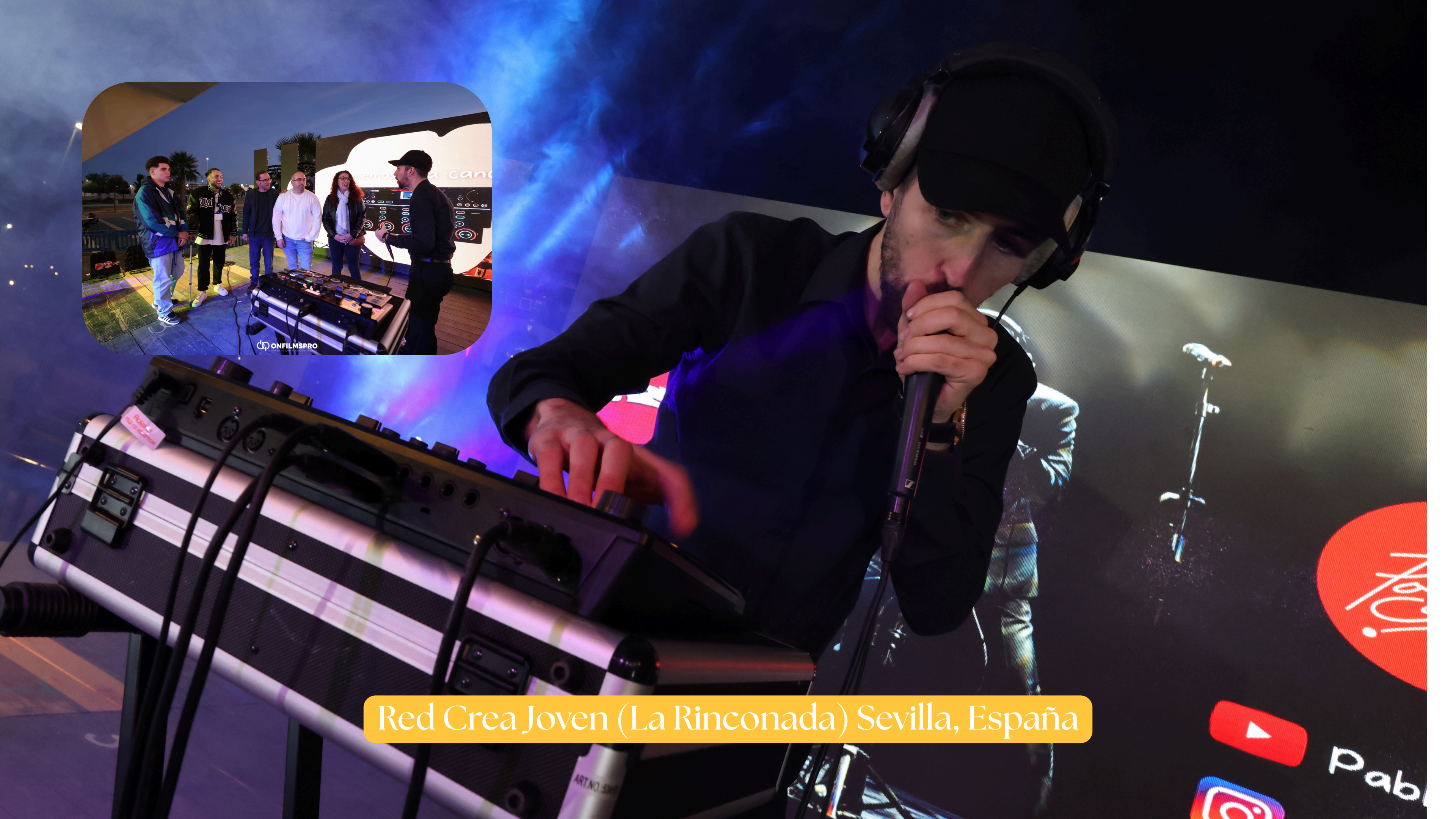
Red Crea Joven (La Rinconada) Sevilla, España