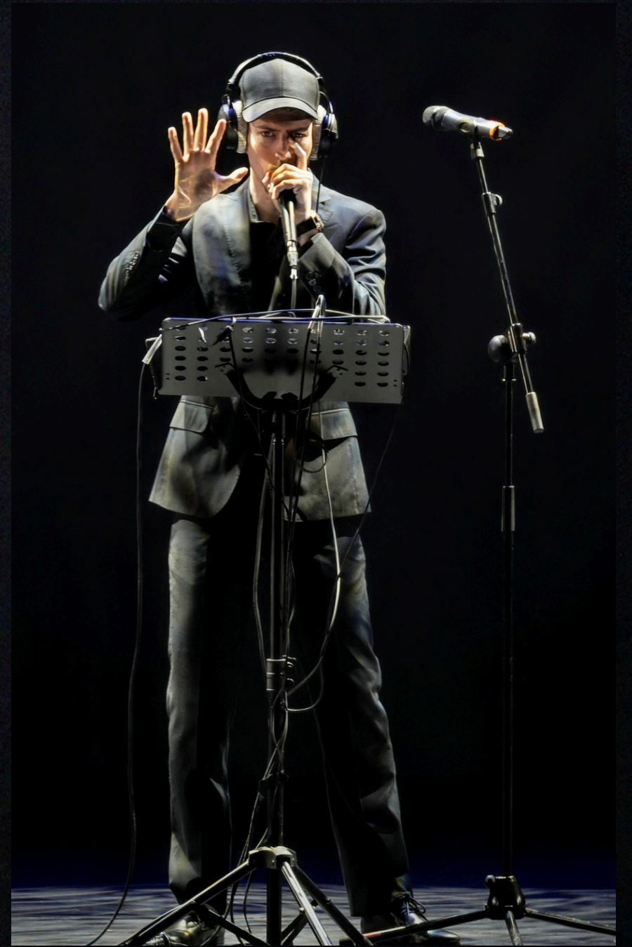
Festival internacional de musica acapella en Zaragoza, España